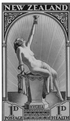
Rys. 6. Znaczek z Nowej Zelandii z 1932 r. przedstawiający Hygeię. Fig. 6. Postal stamp representing Hygeia, New Zealand, 1932

Najbardziej bulwersujące wyobrażenie Hygei znalazło się na znaczku pocztowym wydanym w 1932 r. w Nowej Zelandii i przedstawiającym młodą, zmysłową, półnagą kobietę siedzącą z odchyloną do tyłu głową na postumencie z napisem „Hygeia” i sprawiającą wrażenie pijanej lub odurzonej