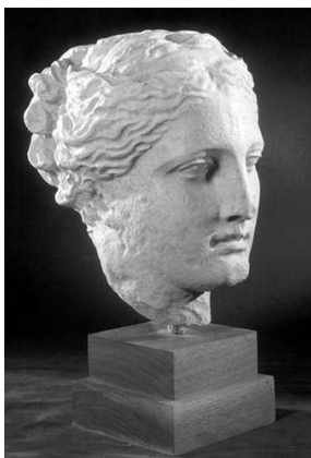
Rys. 2. Głowa Hygei (Muzeum w Nowym Jorku). Fig. 2. The Head of Hygieia (Museum, New York)

Do najstarszych i najbardziej nietypowych wizerunków Hygei należy ten, który znajduje się na okrągłym pojemniku z przykrywką, wykonanym z terakoty przez anonimowego artystę między 420 a 410 r. p.n.e., a przechowywanym od 1909 r. w Metropolitan Museum of Art w Nowym Jorku. Wykonany jako ślub-