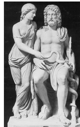
Rys. 3. Posąg Asklepiosa i Hygei (Muzeum w Watykanie). Fig. 3. Statue of Asklepios and Hygieia (Vatican Museum)

W Narodowym Muzeum w Atenach znajduje się niezwyklej urody głowa Hygei wykonana około 350 r. p.n.e. przez Skopasa i znaleziona w trakcie prac prowadzonych w latach 1900-1902 w ruinach świątyni Ateny w Piali (dawna Tegea). Uwagę przyciąga jej podłużna twarz i pełne głębokiej melancholii oczy [21].