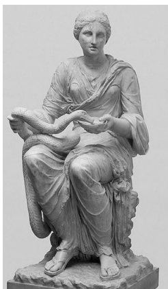
Rys. 4. Posąg Hygei pochodzący z I w. n.e. (zbiory Ermitażu). Fig. 4. Statue of Hygeia dated 1 st century A.D. (Hermitage)

Typowa jest pochodząca z I w. n.e. statua Hygei przechowywana w Ermitażu w St. Petersburgu w Rosji. Hygeia siedzi ubrana w delikatnie udrapowany chiton i spogląda na widza, karmiąc węża z naczynia trzymanego w lewej ręce.