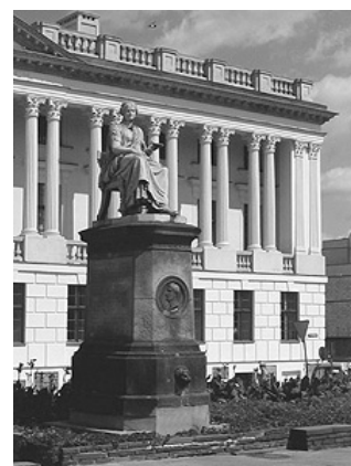
Rys. 5. Pomnik Hygei w Poznaniu – stan z 2005 r. Fig. 5. Statue of Hygeia in Poznan – as of 2005 A.D.